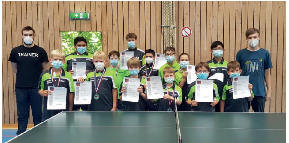
Das Foto zeigt die erfolgreichen Fockbeker Teilnehmer*innen mit Trainern.