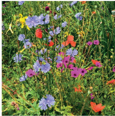
links: Heimische Wildtulpe (Tulipa sylvestris)